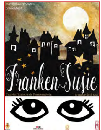
Co-production La compagnie du Chahut, Sublime Théâtre