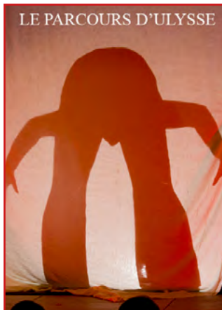
Co-production coMca, Cont'Animés, Sublime Théâtre